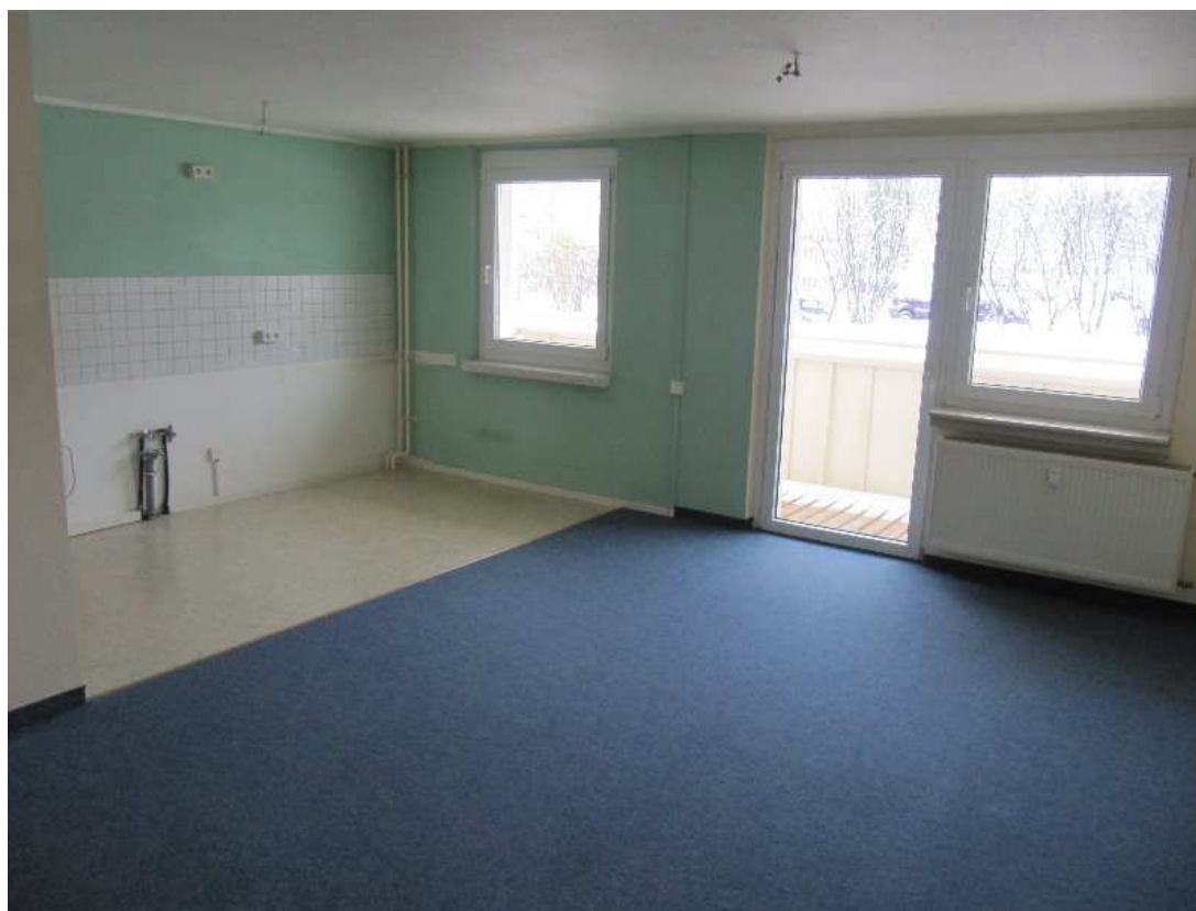
Wohnzimmer mit Kochnische