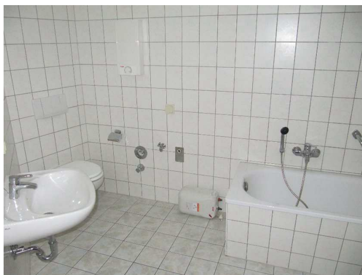
Bad / WC